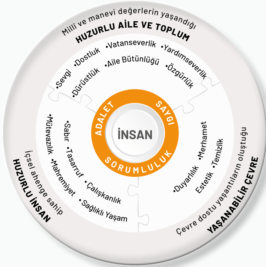
Bilgi Görseli: Erdem-Değer-Eylem Çerçevesi

Erdem Değer Eylem Çerçevesi'nde çatı değerler etrafında kümelenen bir değer çerçevesi sunulmaktadır. Çatı değerler, diğer bütün değerler ile yoğun kesişim noktaları olan değer yapılarını ifade etmektedir. Modelde saygı, sorumluluk ve adalet çatı değerler olarak yer almaktadır. Kişisel hayat açısından önemli olan tasarruf, sabır, mahremiyet, mütevazılık, sağlıklı yaşam ve çalışkanlık değerleri insan; sevgi, dostluk, özgürlük, dürüstlük, vatanseverlik, yardımseverlik ve aile bütünlüğü değerleri aile ve sosyal çevre; temizlik, duyarlılık, estetik ve merhamet değerleri ise fiziksel çevre alanlarında yer almaktadır. Değerlerin hangi alanla ilgili olduğuna karar verilirken daha çok katkı sağladığı alan dikkate alınmıştır. Erdem Değer Eylem Çerçevesi; eğitim öğretimde mutlaka yer alması gereken değerleri içermesi açısından sade, değer alanları ve değerlerin birbirleriyle ilişkileri açısından tutarlı, kolay uygulanabilir olması açısından da kullanılabilir olarak tasarlanmıştır.